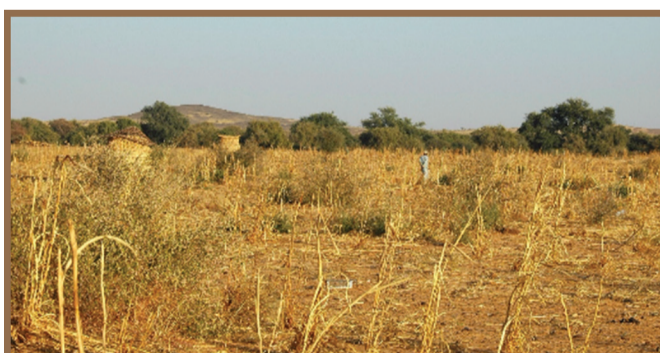
Buleen bayi ñax si tool yi ndax defay laxx jinax diko dëkëlo si biir toolyi