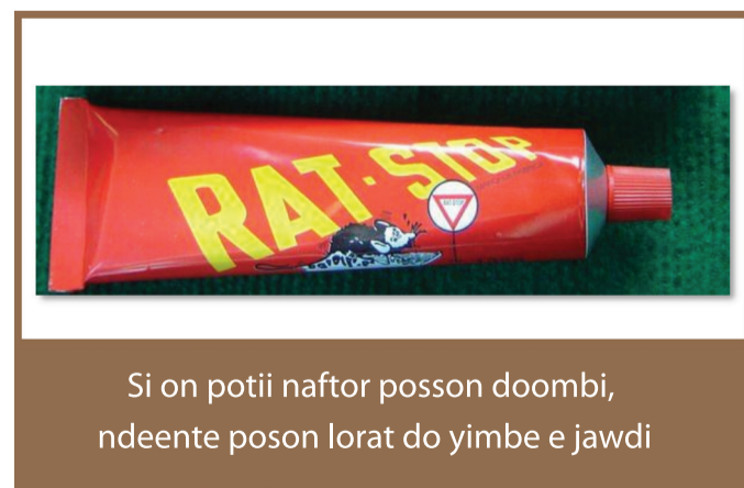
Si on potii naftor posson doombi, ndeente poson lorat do yimbe e jawdi