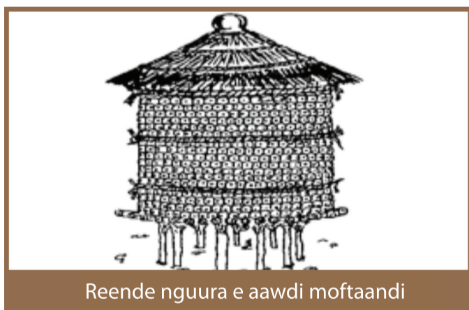
Reende nguura e aawdi moftaandi