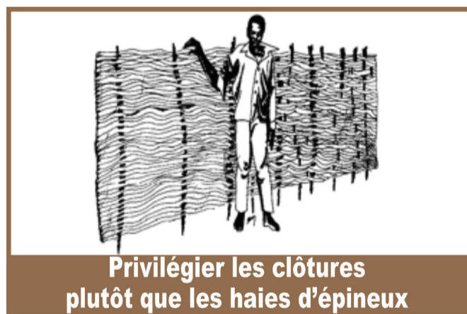
Privilégier les clôtures plutôt que les haies d'épineux