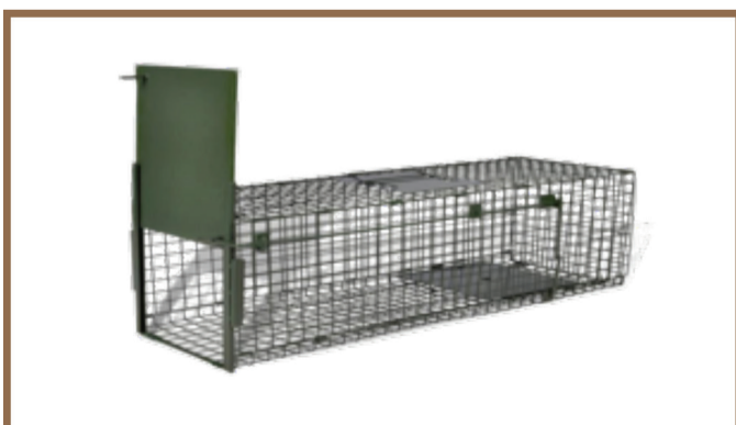
Farataal fir buy rey jinax