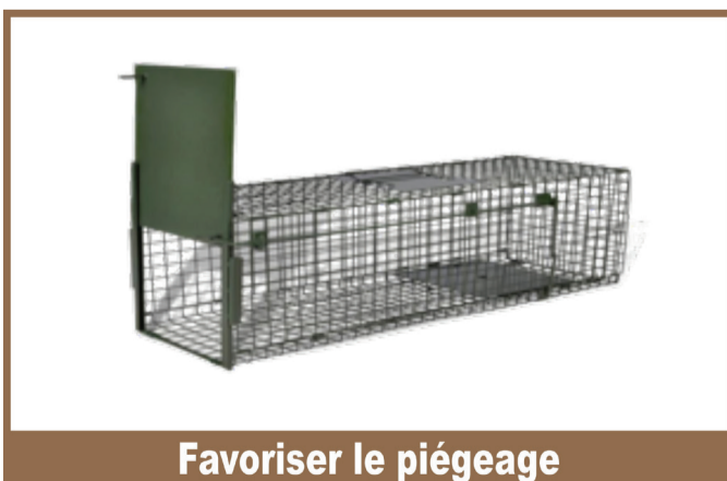
Favoriser le piégeage