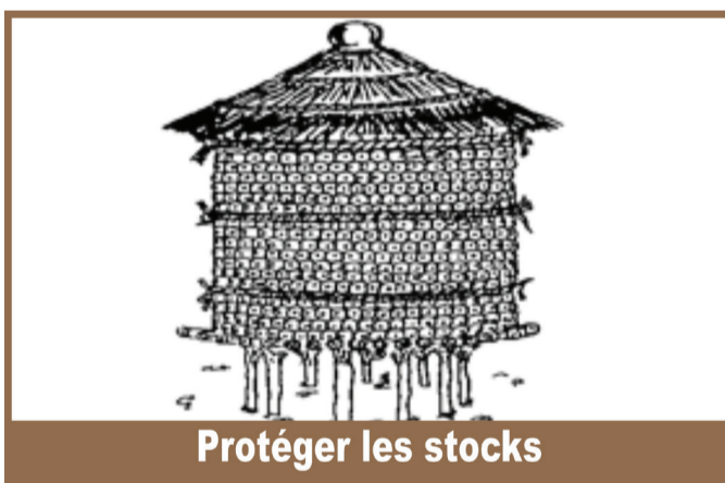
Protéger les stocks