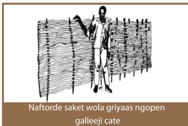
Naftorde saket wola griyaas ngopen galleeji cate