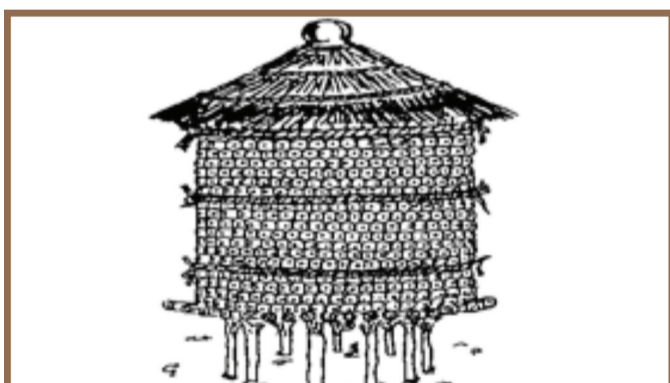
Aar ñiñuy denc dundë ngir jinax bañ si diot