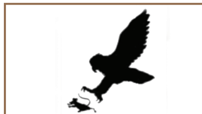
Aar looy ak beppë picc wala mala buy rëbb jinax