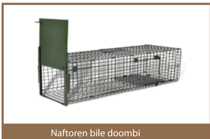
Naftoren bile doombi