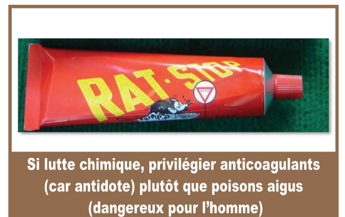
Si lutte chimique, privilégier anticoagulants (car antidote) plutôt que poisons aigus (dangereux pour l'homme)