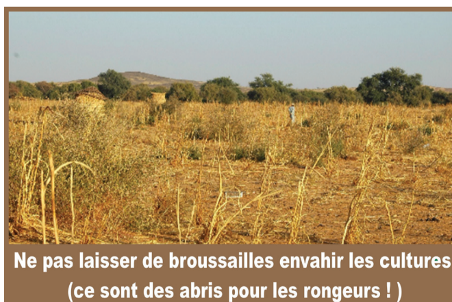
Ne pas laisser de broussailles envahir les cultures (ce sont des abris pour les rongeurs !)