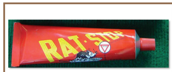
Sooleen di jëfëndikoo possonu jinax, moytuleen bu baax yenna xeetu posson yi lor nitt ak jur