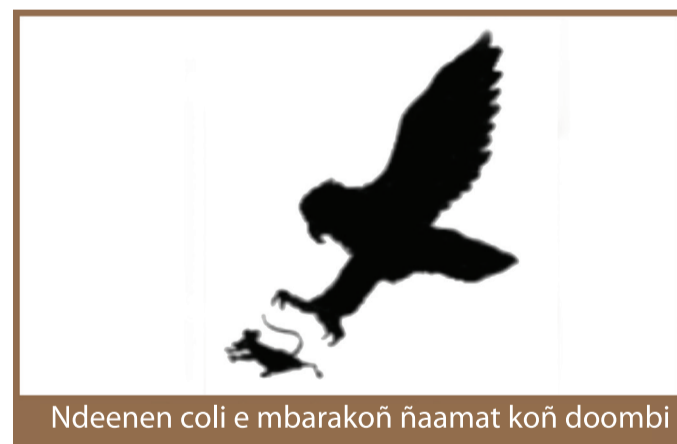
Ndeen en coli e mbarakoñ ñaamat koñ doombi