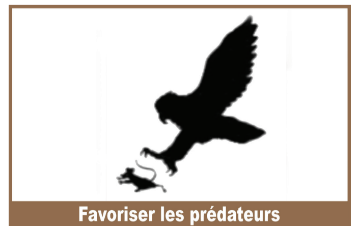
Favoriser les prédateurs