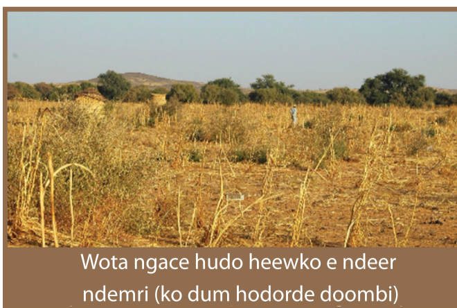
Wota ngace hudo heewko e ndeer ndemri (ko dum hodorde doombi)